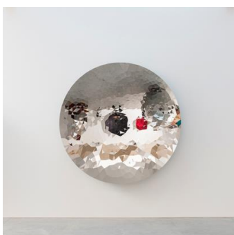
Anish Kapoor Random Triangle Mirror 2017 © Courtesy The Artist, Anish Kapoor 2018