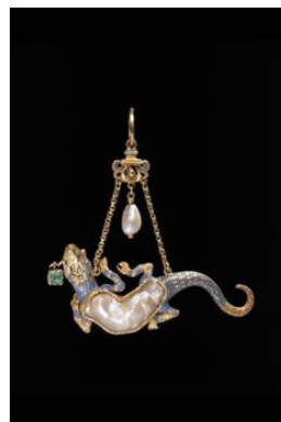
Pendentif en forme de salamandre Europe occidentale, fin du XVI e siècle Salting Bequest, M.537- 1910