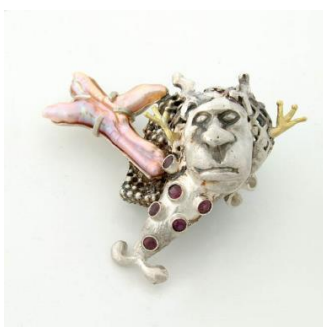
Peter Vermandere Broche Ik geef me over (Manneke II) (de la série Carnavalesken en grotesken ) Anvers, 2007