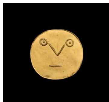
Pablo Picasso Médaillon Visage géométrique aux traits 1967 © Collection RIRA, Cologne, photo : Jan Liégeois