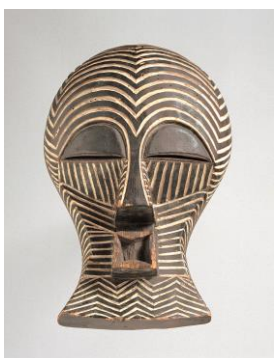
Masque (Kifwebe) peuples Luba/Songye, République démocratique du Congo début du XX e siècle. © MAS, collection Afrique, AE.0335, photo : Michel Wuyts