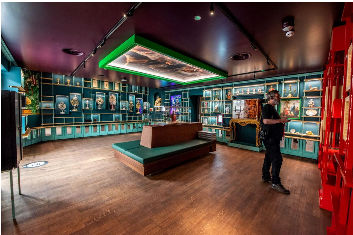
Le Cabinet des merveilles de DIVA

La présentation de la collection de DIVA commence par le Cabinet des merveilles de DIVA. Dans cette version contemporaine d'un cabinet des merveilles, des objets précieux des quatre coins du monde sont réunis dans un cocon de luxe. Les visiteurs sont invités y découvrir le prestigieux passé de la ville d'Anvers – qui au XVI e et début du XVII e siècle était le premier producteur et distributeur d'art et d'articles de luxe – à travers des pièces d'orfèvrerie, des bijoux, des pierres précieuses et des curiosités exotiques comme des noix de coco, des coquillages et des coraux, très convoitées à l'époque. Dans son Cabinet des merveilles, DIVA vous en apprend davantage sur ces objets et leurs collectionneurs.