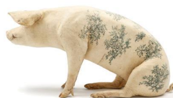
Wim Delvoye Toile de Jouy 2006 © Studio Wim Delvoye