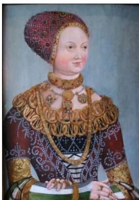
Portrait d'une dame Attribué à Hans Krell, XVI e siècle