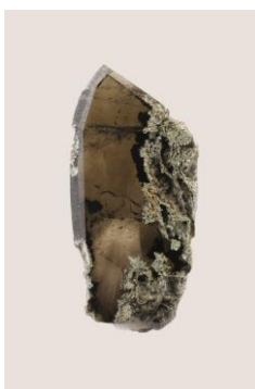
Octave Vandeweghe Cultured Manners #85 Anvers, 2017