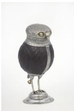
Hannap en forme de hibou Maître avec le pélican, Anvers, 1548-1549